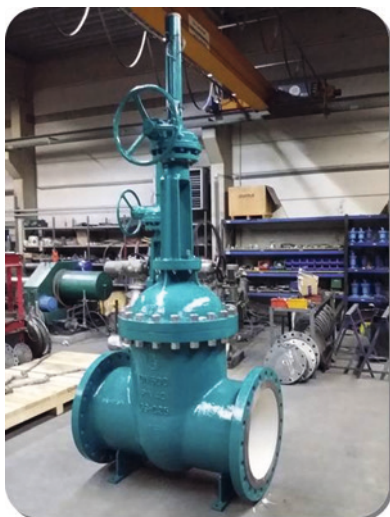
Robust und zuverlässig: Die Armaturen von Brunnbauer entsprechen allen erforderlichen Anforderungen und Normen