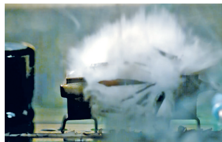
Ausgelöst: Die E-Bulb (Extinguishing Bulb) erkennt Funken und Feuer in elektrischen Geräten, löscht sie und verhindert so größere Schäden