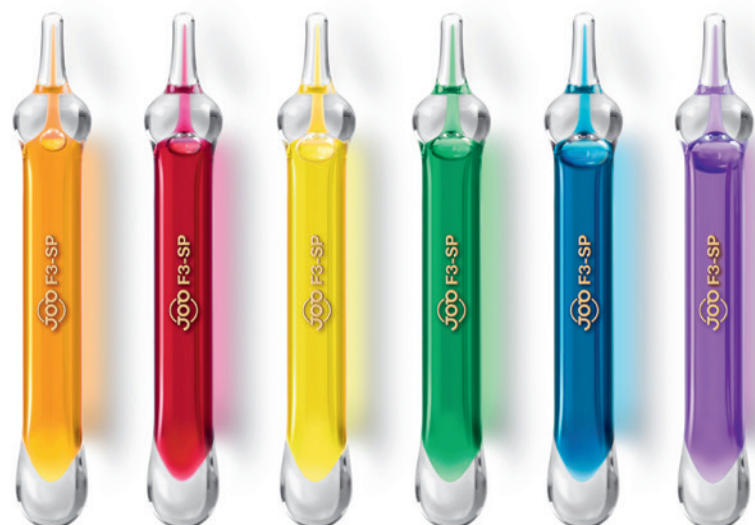
Klein, aber oho: Diese Thermo Bulbs können im Ernstfall Leben retten. Die unterschiedlichen Farben kennzeichnen die jeweilige Auslösetemperatur

„Die Technologie der JOB Thermo Bulbs trägt dazu bei, Brände frühzeitig zu erkennen und gezielt zu löschen.“