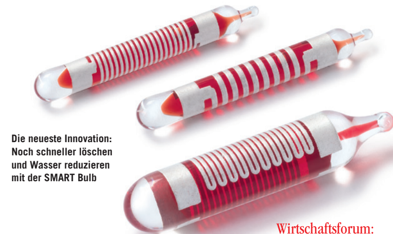
Die neueste Innovation: Noch schneller löschen und Wasser reduzieren mit der SMART Bulb