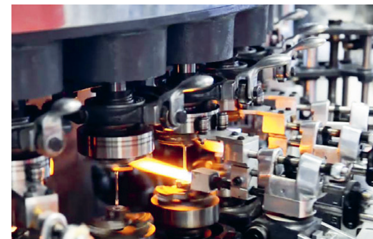
Mit der Rohglasformgebungsmaschine werden die Glasampullen geformt

Im Unternehmen wird die Mensch-zu-Mensch-Beziehung großgeschrieben. So wird viel Wert auf eine gute Kommunikation mit den Mitarbeitern gelegt.